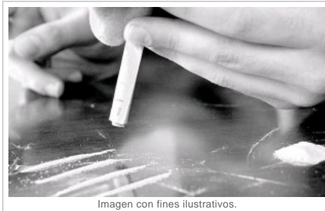
Imagen con fines ilustrativos.

Los investigadores compararon a 1.101 personas de 15 a 49 años con 1.154 personas de edades similares. Más de una cuarta parte reconocieron que