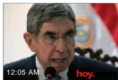
Fiscalía pidió a Canadá ampliar prueba en investigación contra